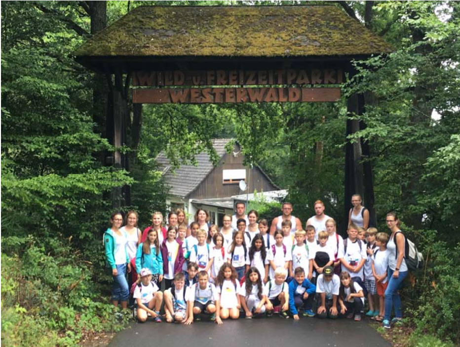
Auf den Spuren Martin Luthers wanderte die Kinderfreizeit diesen Sommer im Taunus.

... das hieß es für 32 Mädchen und Jungen, die am 13. Juli mit einem altbewährten und frohgestimmten Betreuer-Team zur Lindenmühle bei Ergeshausen im Taunus aufbrachen.