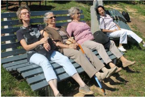
Am Schloss Johannisberg liegen vier Frauen in ökumenischer Eintracht auf der Ruhebänk

besichtigten wir den Schlosshof und die schöne, romanische Basilika.