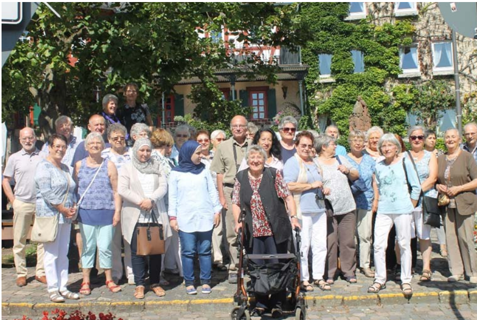
Gruppenfoto mit den 43 TeilnehmerInnen

konnten. Weiter ging's dann nach Kiedrich. In der Basilika St. Valentin aus dem späten 14. Jahrhundert, die als eine der schönsten Kirchenbauten der Region gilt, hielten wir eine kurze Andacht und erfuhren dann noch Interessantes über die Kiedricher Chorbuben, die als Einzige noch den Gregorianischen Choral in der Form des „Gotisch-Germanischen Dialektes“ pflegen und in der