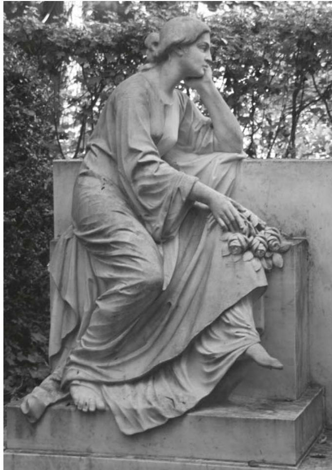
Friedhof Herrnsheim

Neben dem Gruppenangebot besteht zeitlich begrenzt auch die Möglichkeit zu Trauereinzeltbegleitung.